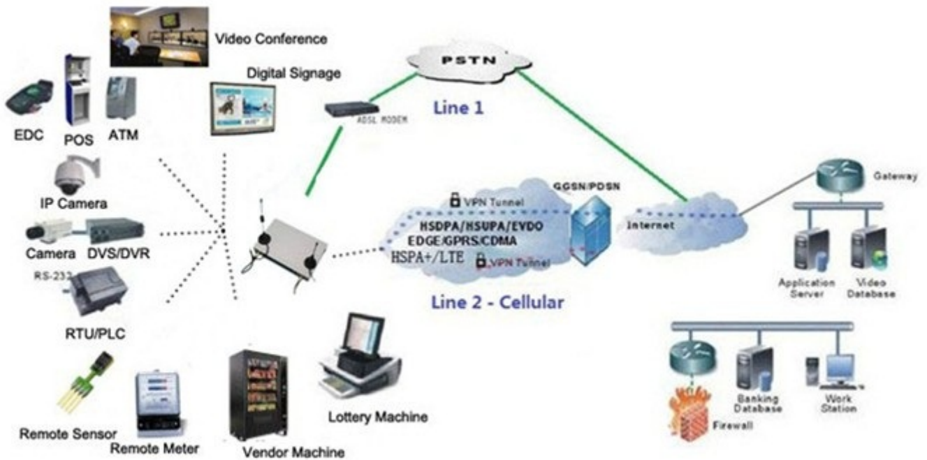
Single H820 Typical Application Diagram