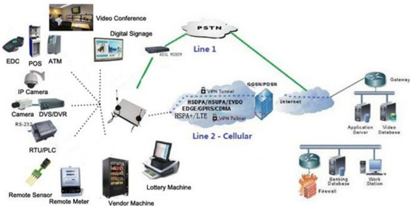
Single H820 Typical Application Diagram